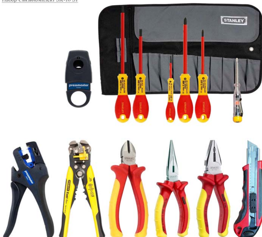
Набор СвязьКомплект SK-16 S1